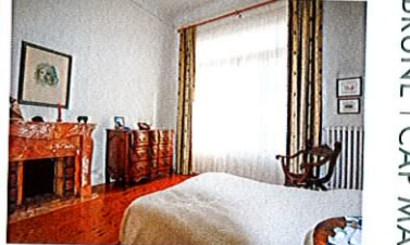
3 PIECES MENTON – CENTRE 398 000 €

Dans une petite copropriété en plein centre ville de Menton, à 2 pas de tous commerces et de toutes commodités, 3P. de 74 m2 composé de séjour, cuisine indép., 2 ch., SdD avec wc, SdB et 2ème wc ind. Dressing room. Petit balcon. Cave. • In a little block of flats in the heart of Menton, very close to all shops and facilities, 3 room apartment of 74 sqm composed of : living room, independent kitchen, 2bedrooms, 2 bathrooms and an independent toilet. Dressing room. Little balcony. Cellar. • DPE : C Réf. 2887