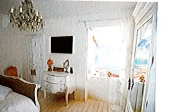
MAISON MENTON – VIEILLE VILLE 299 000 €

Dans le pittoresque quartier historique de Menton, charmante maison sur 2 niveaux, ent. rénovée. Séjour, cuisine US équipée, débarras. A l'étage, 1 ch., SdD avec wc. Vue mer panoramique imprenable. Une propriété unique, à 2 pas du centre ville et de toutes commodités. • In the picturesque historical area of Menton, entirely renovated 2-level house featuring : living room & open plan kitchen with utility room. Upstairs, bedroom, bathroom. Spectacular panoramic sea view. A unique property, just off the town centre and facilities. • Réf. 2949