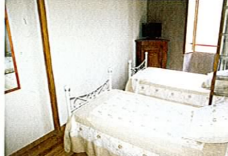
MAISON MENTON – VIEILLE VILLE 375 000 €

A 2 pas de la zone piétonne et des plages, jolie maison sur 2 niveaux composée au RdC d'un séjour avec cuisine US équipée. Au 1er étage : 2 ch. avec mezzanine, SdD avec wc. Grande cave aménageable au niveau -1. Clim. réversible. Double vitrage. • Next to the pedestrian area & the beaches, lovely house on 2 levels featuring on the ground floor : living room & open plan fitted kitchen. Upstairs : 2 bedrooms with mezzanine, shower room. In the basement, large cellar suitable for conversion. A/C, double glazing. • Réf. 2936