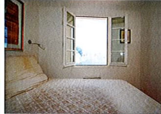
MAISON MENTON – VIEILLE VILLE 450 000 €

Maison de pays sur deux niveaux composée, au rez-de-chaussée, d'un séjour avec cuisine américaine équipée et salle d'eau avec wc et, au premier étage, de deux chambres, dressing, buanderie et salle de bains avec wc. Belle terrasse exposée plein sud avec vue mer panoramique. Proche plages et toutes commodités. Pas de charges! • Close to the sea and all amenities, two-storey town house featuring, on the ground floor : a living room and open plan fitted kitchen, shower room and toilet. Upstairs, two bedrooms, a dressing room, a laundry room and a bathroom with toilet. Beautiful south facing terrace with panoramic sea view. No charges. • DPE : E Réf. 2613