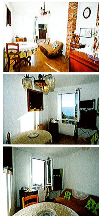
2 PIECES MENTON / PIETONNE 155 000 €

Dans une typique maison mentonnaise, au cœur de Menton, bel appartement 2P. avec magnifique vue mer panoramique. Petite entrée, séjour avec kitchenette, chambre à coucher et SdE avec wc. Idéal pour vacances ou investissement localif. • Right in the town centre, in a typical village house, lovely apartment boasting an enchanting panoramic sea view. Small entrance hall, living room & kitchen, bedroom, shower room. A perfect holiday home or investment for rental income. • DPE : C. Réf. 2677