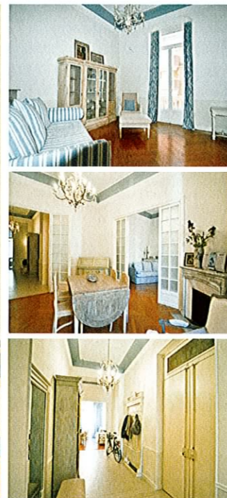
4 PIECES MENTON / CENTRE 740 000 €

Au cœur de Menton, au 2 ème étage d'un immeuble en style bourgeois avec ascenseur, 4P. de 117 m 2 composé de séjour, cuisine ind. équipée, 3 ch., SdB et SdD. Cave. Petit balcon et vue échappée mer. A 2 pas de tous commerces et des commodités. • Right in the town centre, on the 2nd floor of a bourgeois building with lift, 4 roomed flat of 117sq.m. Living room, separate fitted kitchen, 3 bedrooms, bathroom, shower room. Cellar, tiny balcony enjoying a glimpse of the sea. • DPE : C Réf. 2963