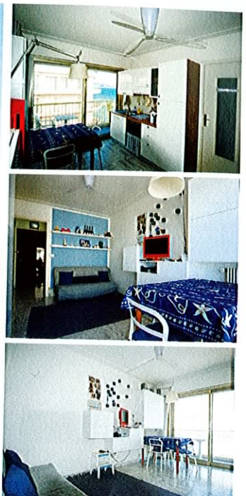
2 PIECES ROQUEBRUNE / PLAGE 220 000 €

Dans un immeuble front de mer de bon standing avec ascenseur et gardien, au 6 ème et dernier étage, très lumineux 2P. : entrée, séjour avec cuisine us équipée, ch. et SdE. Possibilité d'acheter un parking en +. Belle vue échappée mer. Idéal pour vacances. • On the sea front, in a building with caretaker and lift, on the 6th and top floor, very sunny flat : entrance hall, living room, open fitted kitchen, bedroom, shower room. Parking available with extra charge. A perfect holiday home. • Réf. 2969